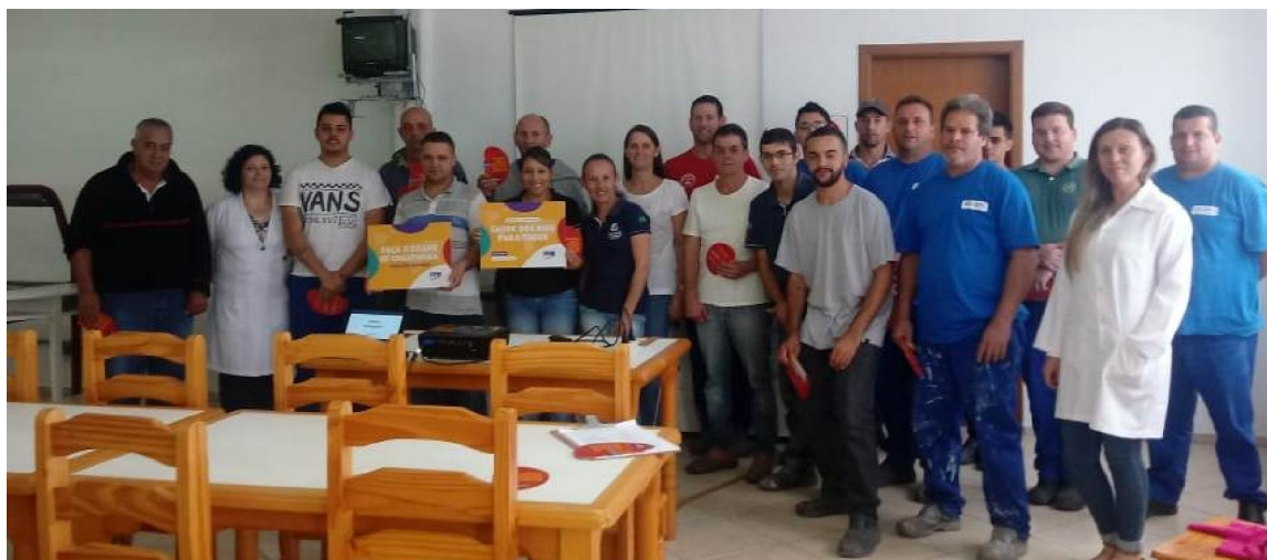
Equipe de SBS em uma das palestras de prevenção à doença renal, realizadas em empresas e escolas da região.