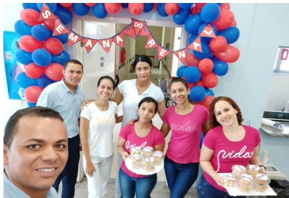
Equipe preparando o lanche especial para a Semana do Renal, evento realizado anualmente em todas as unidades.