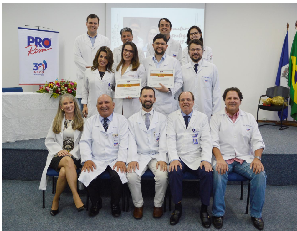
Formatura do Programa de Especialização em Nefrologia realizada em 2019 com a presença da equipe médica da Instituição e os recém-formados.

O programa é dividido em duas modalidades: Especialização em Nefrologia, indicado para profissionais que já tenham experiência em clínica médica; e a Especialização em Clínica Médica e Nefrologia, para profissionais sem experiência clínica e para recém-formados. Todos os residentes que ingressam no programa atuam diretamente na realidade das atividades da instituição, incluindo as áreas de nefrologia clínica, transplante, hemodiálise, diálise peritoneal e clínica médica, além de atuarem e conhecerem os atendimentos no Hospital Municipal São José e no Hospital Regional Hans Dieter Schmidt.