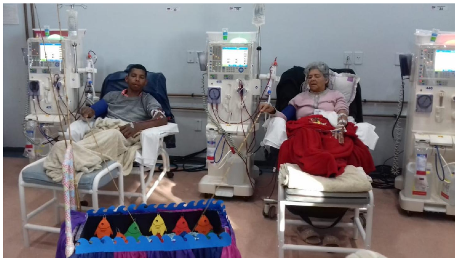
Pacientes se divertem em ação da Festa Junina.