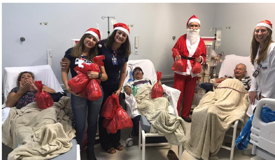
Campanha de arrecadação e doação de panetones aos pacientes renais crônicos, uma das ações realizadas pelo Voluntariado.