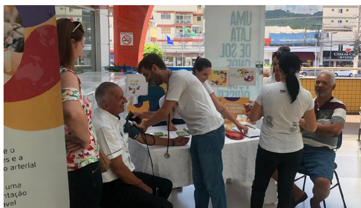
Ação da equipe de BC referente ao Dia Mundial do Rim 2019 em supermercado da cidade.