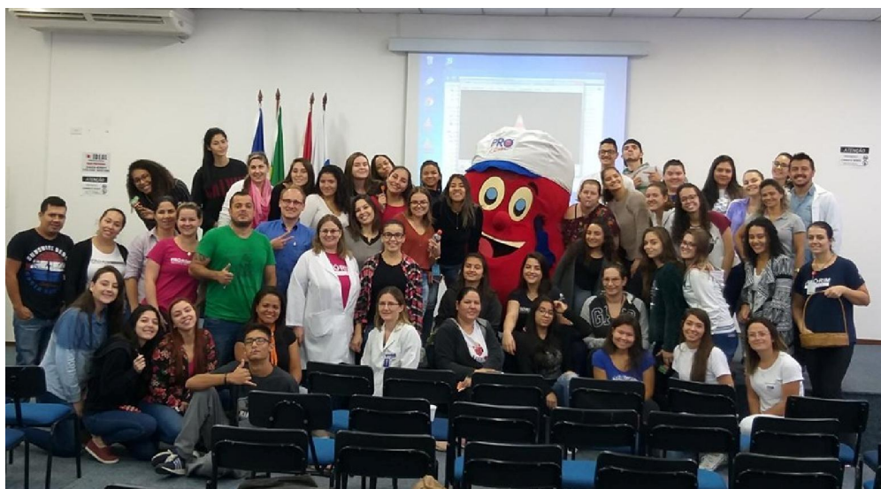
Alunos participam de ação da Semana da Enfermagem.

Durante o ano de 2019, o Instituto formou 2.308 alunos , entre os cursos de qualificação, técnico ou de especialização.