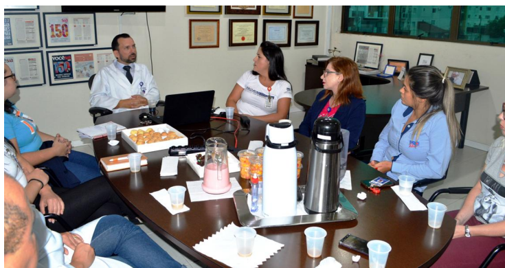
Café com Ideias, um momento de aproximação da diretoria com os colaboradores.