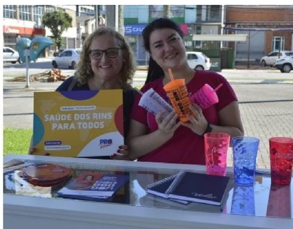
Dois das centenas de clientes dos Produtos Sociais que se engajaram à causa da Pró-Rim. Uma das ações de comercialização em eventos sociais.